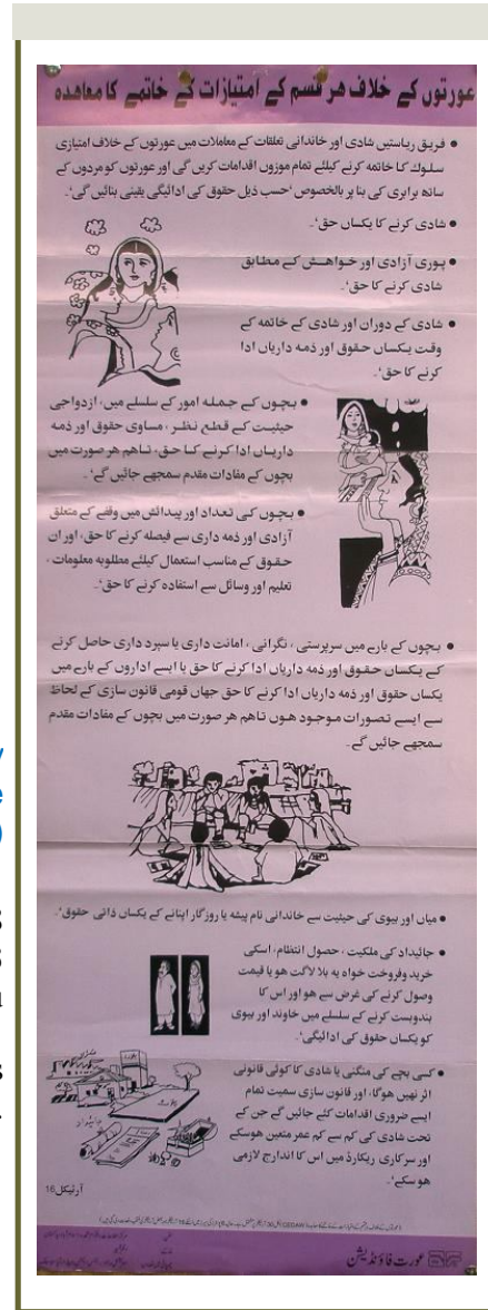
Title: Aurtoon kay Khilaf har qisam kay Imtiazat kay khatmay ka Muhaida: Article 16 (Purple)

This poster consists of CEDAW articles. In this contains gives 16 articles and sub-articles.